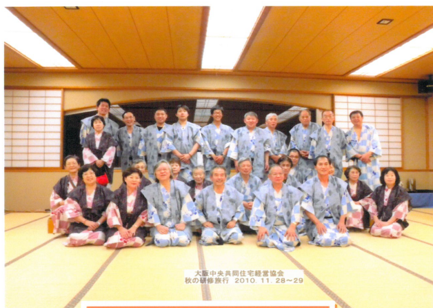
大阪中央共同住宅経営協会 秋の研修旅行 2010. 11. 28～29