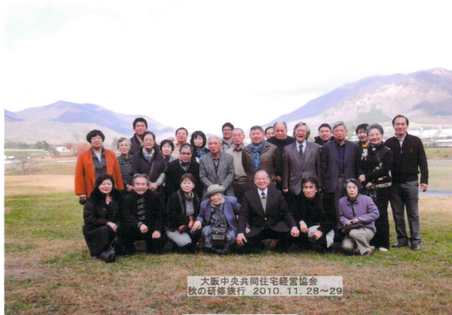
大阪中央共同住宅経営協会 秋の研修旅行 2010. 11. 28～29

感想：少し寒さを感じましたが、2 日間好天に恵まれ、のんびりと実に楽しい旅行を満喫しました。