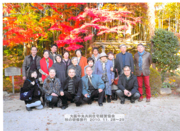
大阪中央共同住宅経営協会 秋の研修旅行 2010. 11. 28～29