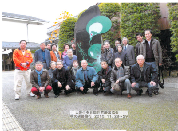
大阪中央共同住宅経営協会 秋の研修旅行 2010. 11. 28～29