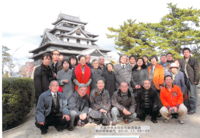
大阪中央共同住宅経営協会 秋の研修旅行 2010. 11. 28～29